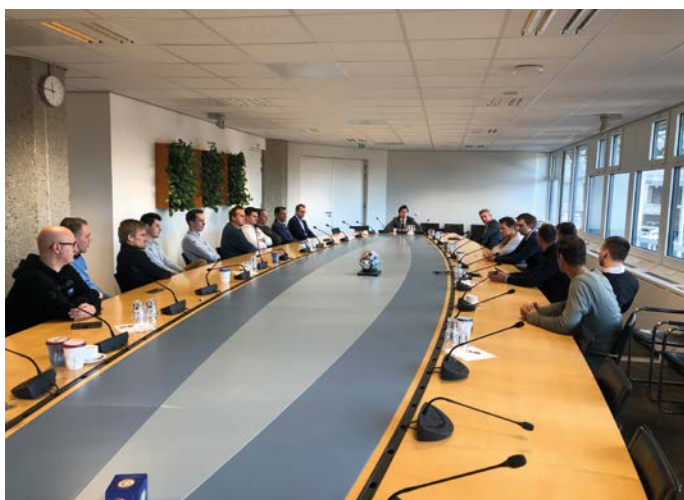
Bezoek ASC cursisten aan de Tweede Kamer.