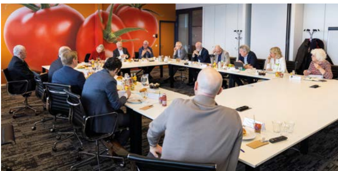
Werkbezoek minister van LNV aan PlantNet International.