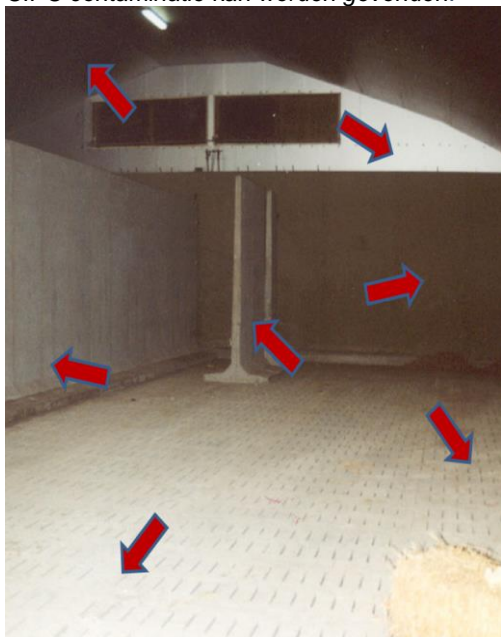
Figuur 2: Plekken in de aardappelbewaarloods waar CIPC contaminatie kan worden gevonden.