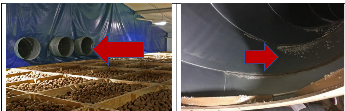
Figuur 4 en 5: Luchtkoeling en luchtgeleidingsbuizen in kistenbewaring.